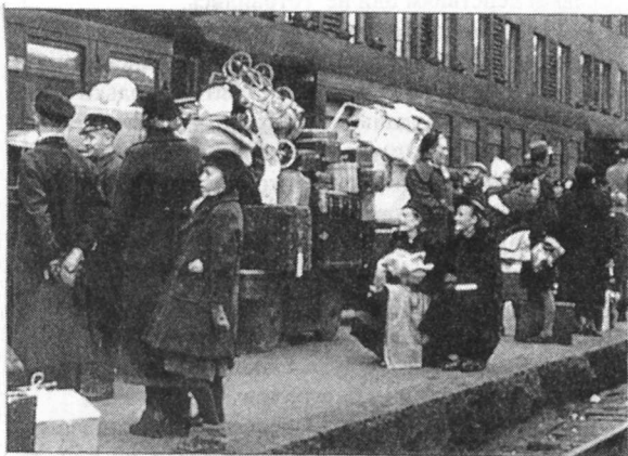
Эвакуированные на вокзале в Хельсинки. Октябрь 1939 года

Хитросплетение политических, этнических, языковых, религиозных и экономических проблем региона привело к тому, что "период племенных войн" в Восточной Карелии, как именуется это время в финской истории, завершился только в феврале 1922 года. Но вплоть до 1925 года Советское правительство с определенной опаской относилось к карелам: по сообщениям безопасности они даже были освобождены от службы в армии.